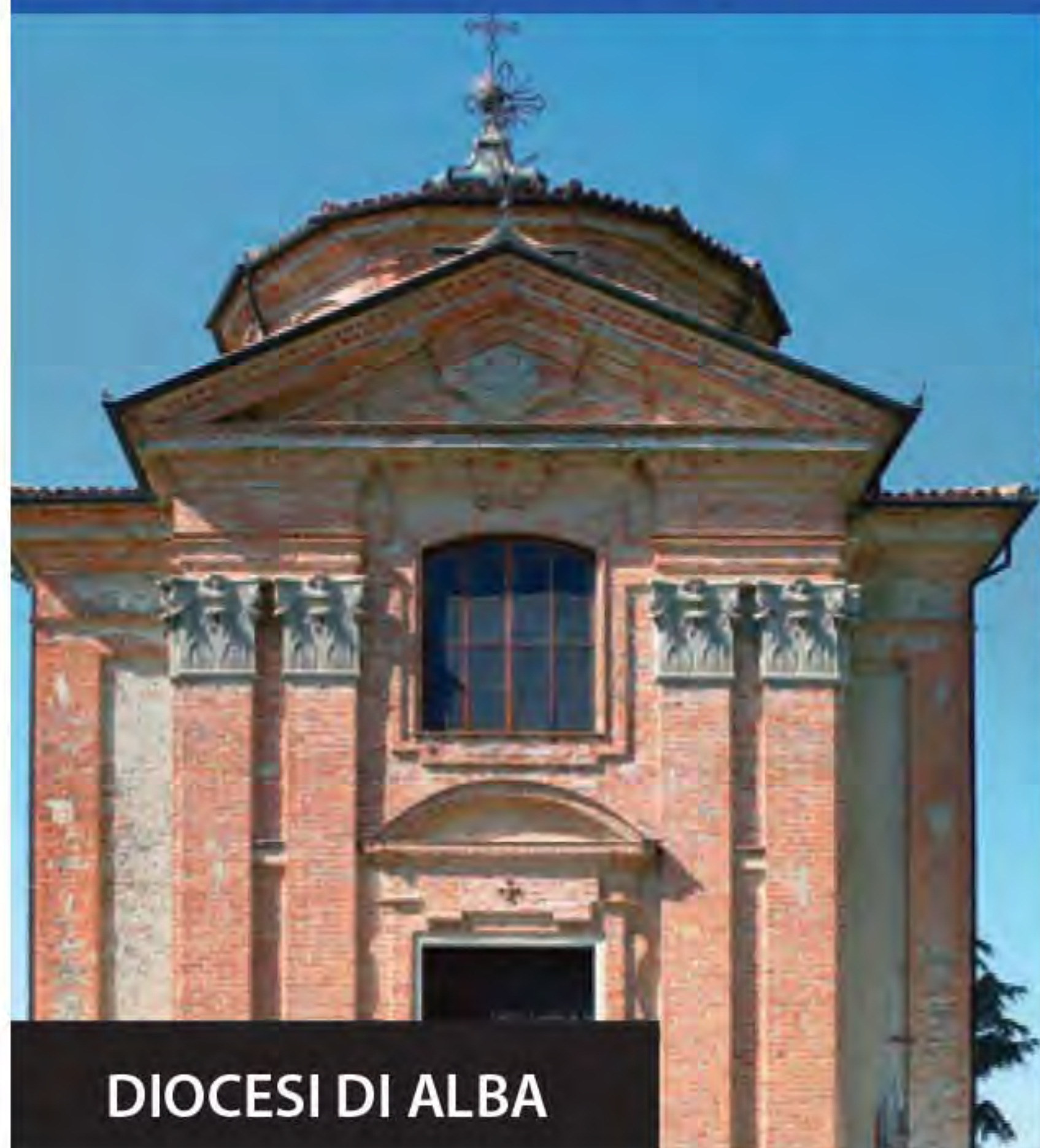
DIOCESI DI ALBA