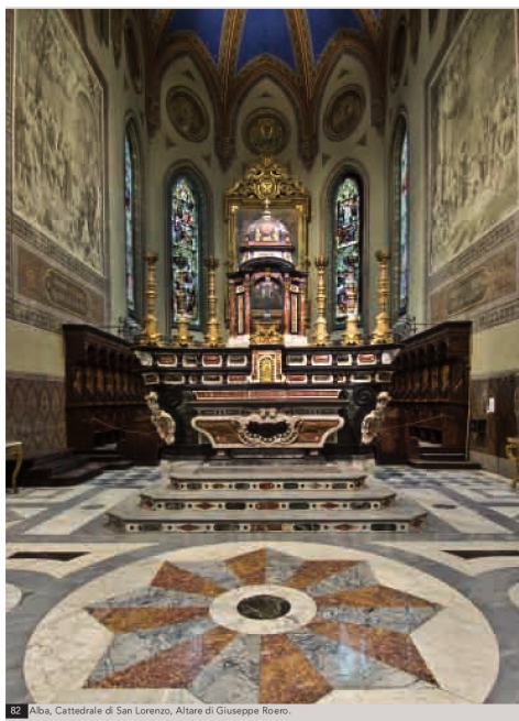
82 Alba, Cattedrale di San Lorenzo, Altare di Giuseppe Roero.